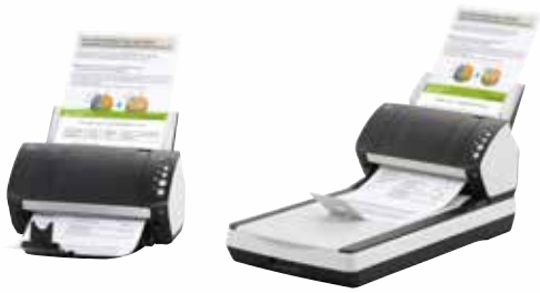
fi-7140 / fi-7240 – A4 Hochformat bei 300 dpi 40 S./Min / 80 B./Min.