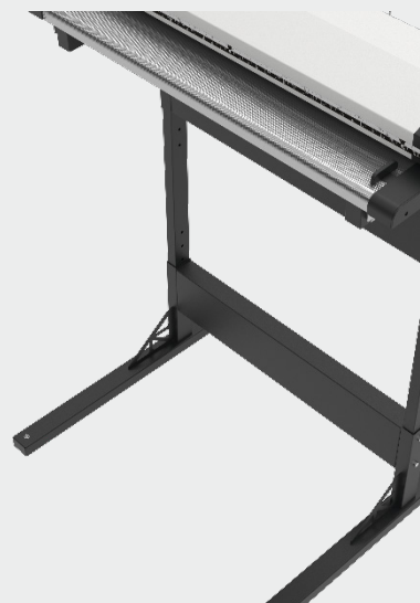
Höhenverstellbarer Stand inklusive